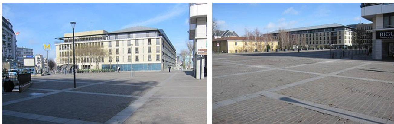
Parvis Corentin Celton - État actuel

Tout le reste est désert, sans âme et particulièrement sinistre : morne plaine l'hiver, plaque solaire l'été. Ouverte à tous les vents, la place est de ce fait un simple lieu de passage entre la ville et l'hôpital Corentin Celton ou la Roseraie : Faute de mobilier urbain notamment de bancs, d'aménagements, d'ombrage les gens ne s'arrêtent pas, n'utilisent pas l'espace.